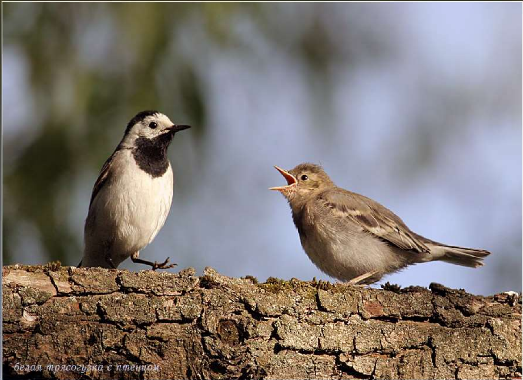
белая трясогузка с птенцом